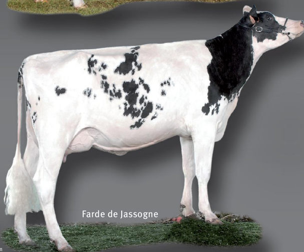
Farde de Jassogne

Mention honorable Jeune vaches - Nuit de la Holstein 2008 -