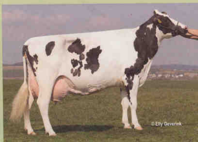
Hilla VG-88, une fille de testage de Gibor qui a déjà produit 65000 kg et qui a vêlé pour la 7 e fois en 6 ans.

En raison du déficit d'image mentionné préalablement, Gibor n'a pas reçu beaucoup d'opportunités dans le segment génétique de premier plan et le nombre de mères à taureaux est resté limité. "Nous essayons de les trouver, mais pour le moment l'offre est très restreinte," annonce Meinikmann. A un premier stade, RUW a testé 5 fils de Gibor. Et 20 à 30 autres devraient suivre, dont un certain nombre qui restent encore à produire. Il en va de même pour les fils des filles de Gibor. "Pendant les nombreuses années à venir nous testerons des fils et des petits-fils de Gibor en raison de ses qualités exceptionnelles et de son lien héréditaire limité avec la population. "Non, ce n'est probablement qu'avec ce Taureau en vue tardif le dernier article sur Gibor a été écrit. ●