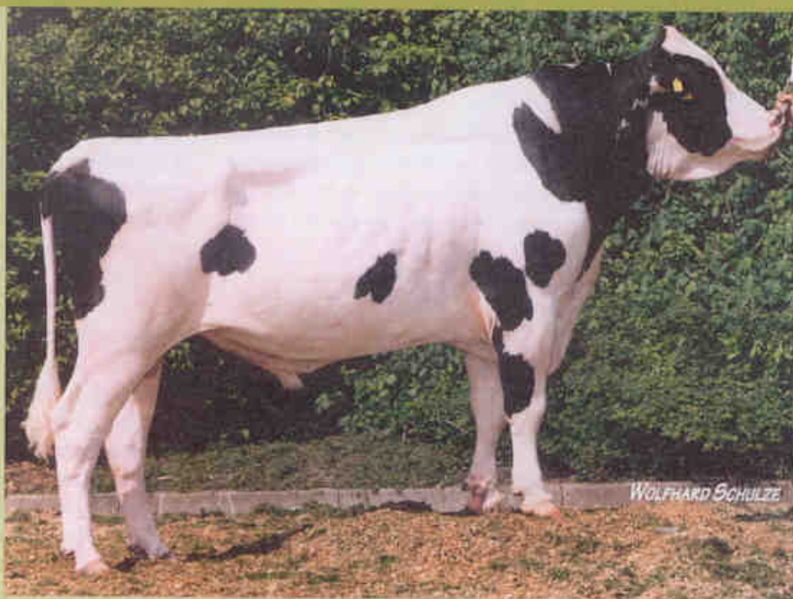
Gibor manifeste ses droits en se basant sur plus de 8300 filles; il est aujourd'hui le taureau numéro 2 en Allemagne.

L'EX-90 Sunny Boy mère de Gibor avait à son tour une mère très durable, Festivale EX-90. Elle était une fille du fils de Tradition Ripvalley Sweet Haven Travis (ou Travis comme on l'appelait en France), demi-frère de Bell Troy et par la suite meilleur apporteur